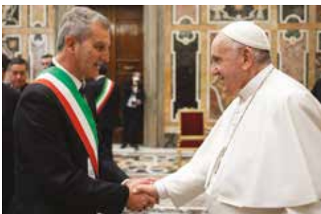
Il Papa incontra tutti i Sindaci