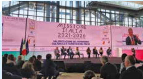
ANCI Lombardia a Roma per Missione Italia - PNRR dei Comuni e delle Città