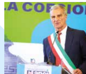
L'Assemblea dei Sindaci del 12 ottobre ha confermato Mauro Guerra Presidente di ANCI Lombardia